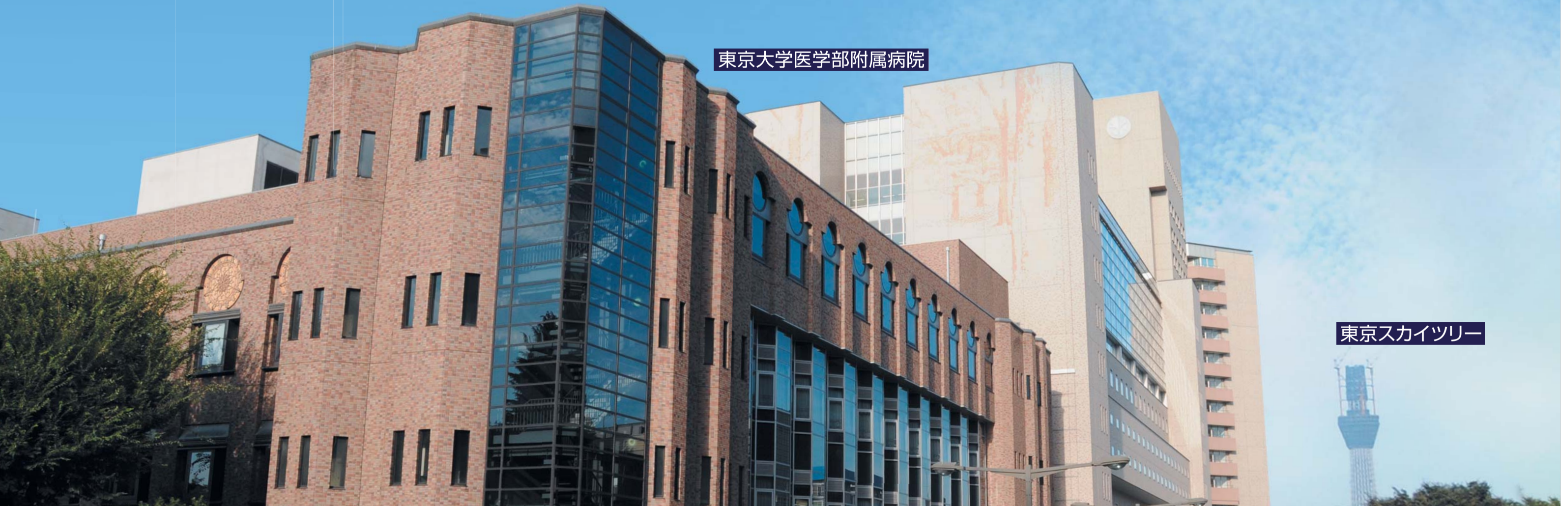
東京大学医学部附属病院